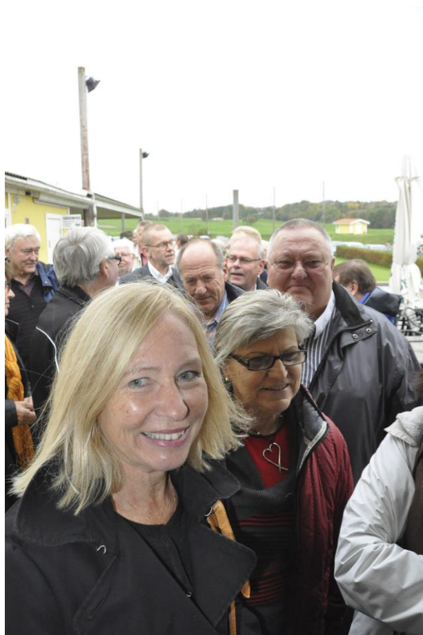
Många trängdes i golfklubbens lokaler. På väggen visas gamla bilder från Torslanda flygplats. (586)