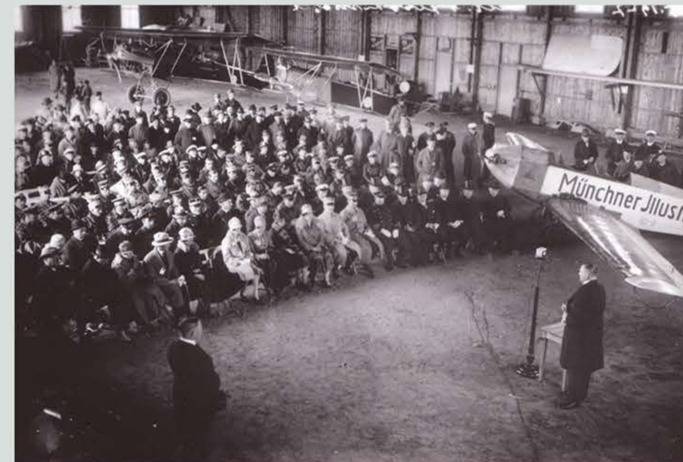
Interiör av hangarbyggnaden. Flygplanet är en Daimler L20BI regnr D-977. Bild troligen tagen i samband med en flygdag 1927. Notera hur spartansk hangaren är, inte mycket bättre än en lada. Isolerades efterhand, men det blev aldrig riktigt bra.