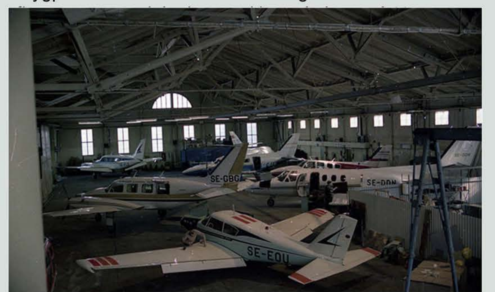
Bland hyresgästerna under den sista perioden innan avveckling 1977 så återfanns taxifyg och företagsflyg tillsammans med privata flygplan. Viss serviceverksamhet fanns även samt polisens helikoptrar.