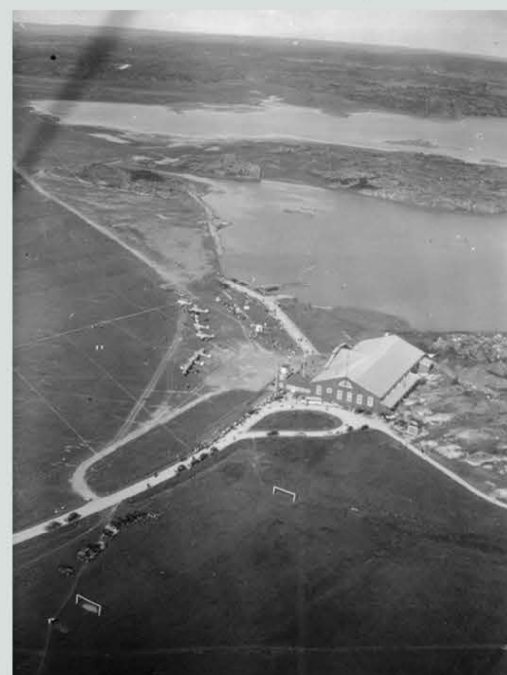
Blå hangaren från ovan. Troligen tidigt 30-tal. Slipen med angoring för flygbåtar och kantskoning för fältets invallning ses i den övre delen av bilden