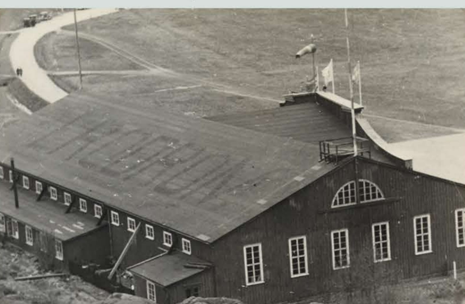
Baksidan av hangaren. Notera texten på taket: AERODROM