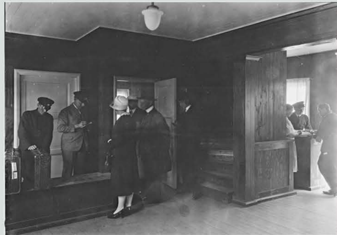
Tidig interiörbild från 1 våning i vinkelbyggnaden. Incheckning av passagerare inför flygning.