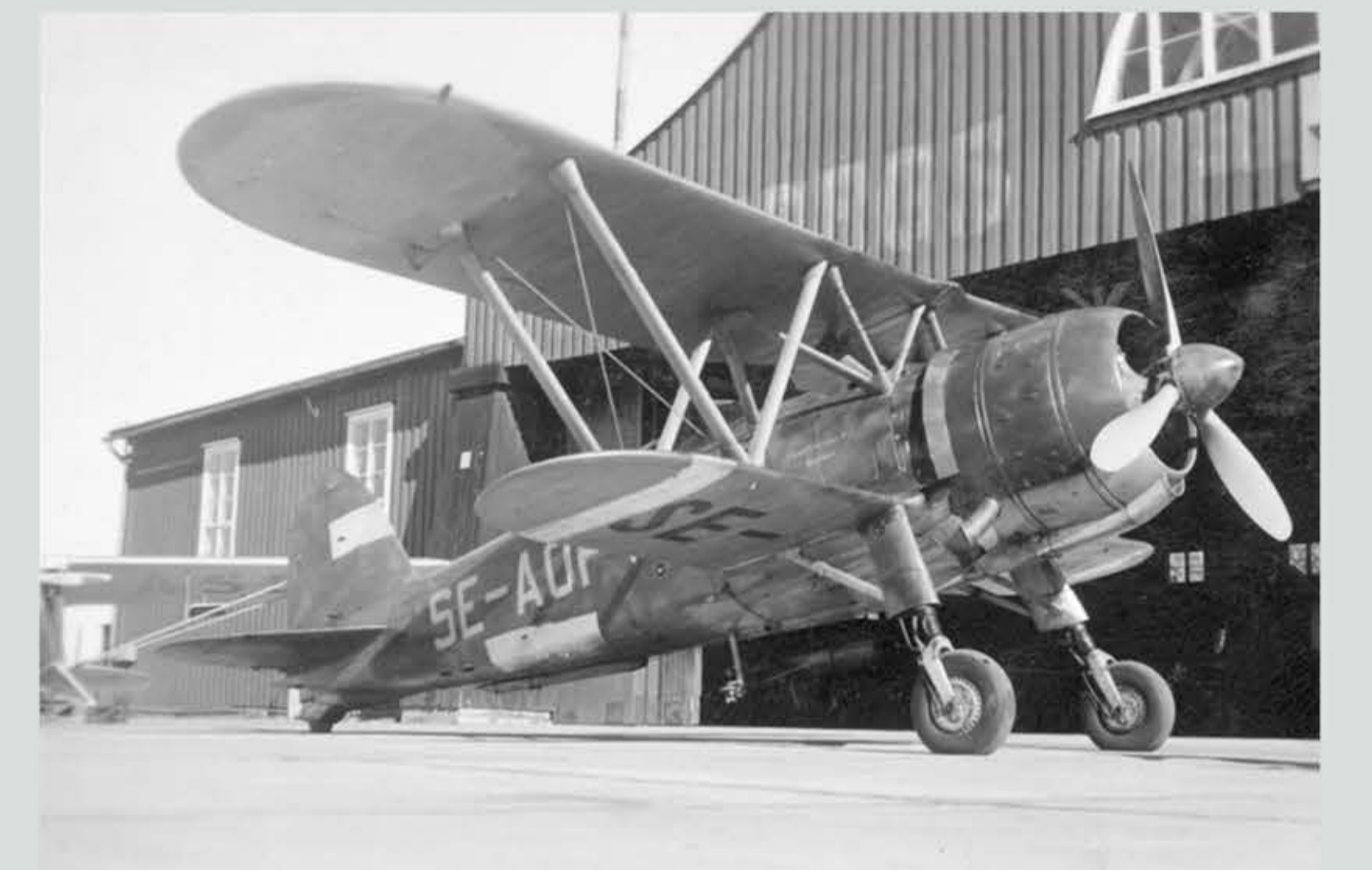
Blå hangaren nyttjades under 40-50-talet av bland annat av Svensk flygtjänst som utförde målbojsering för försvar. Flygplanet är FIAT CR-42 som tidigare hade varit i