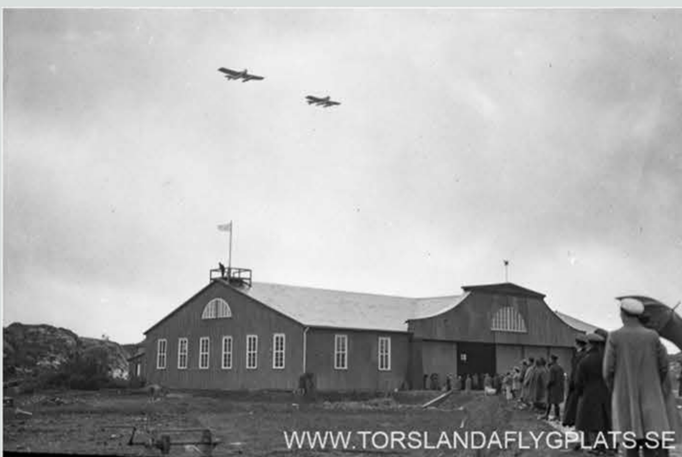
Hangaren blev klar till den stora flygutställningen ILUG i augusti 1923 som blev en stor folkfest.