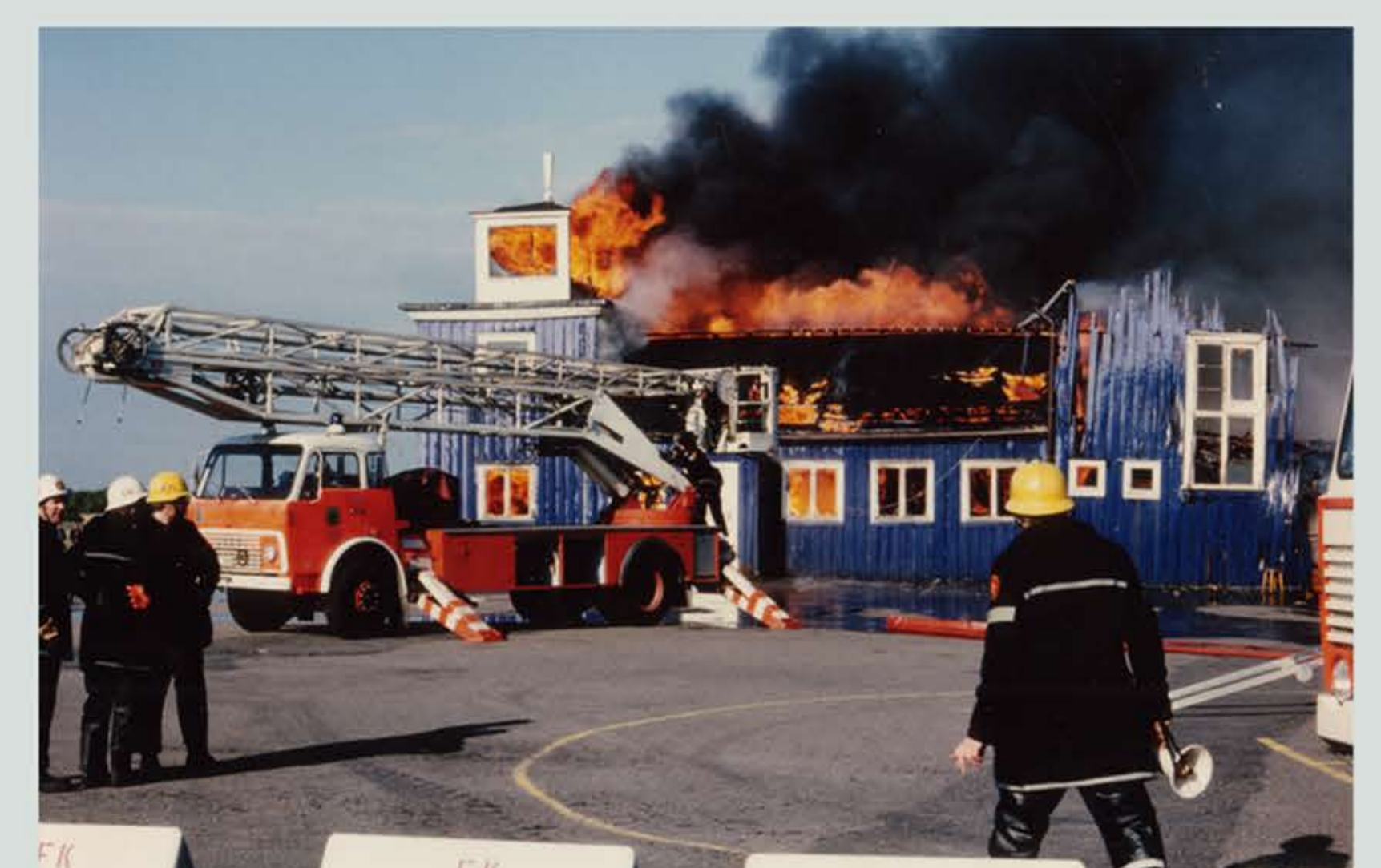
Det sorgliga slutet för blå hangaren. Det ödelades vid en anlagd brand den 31 maj 1980. Den var då på väg att bli byggnadsminnesförklarad.