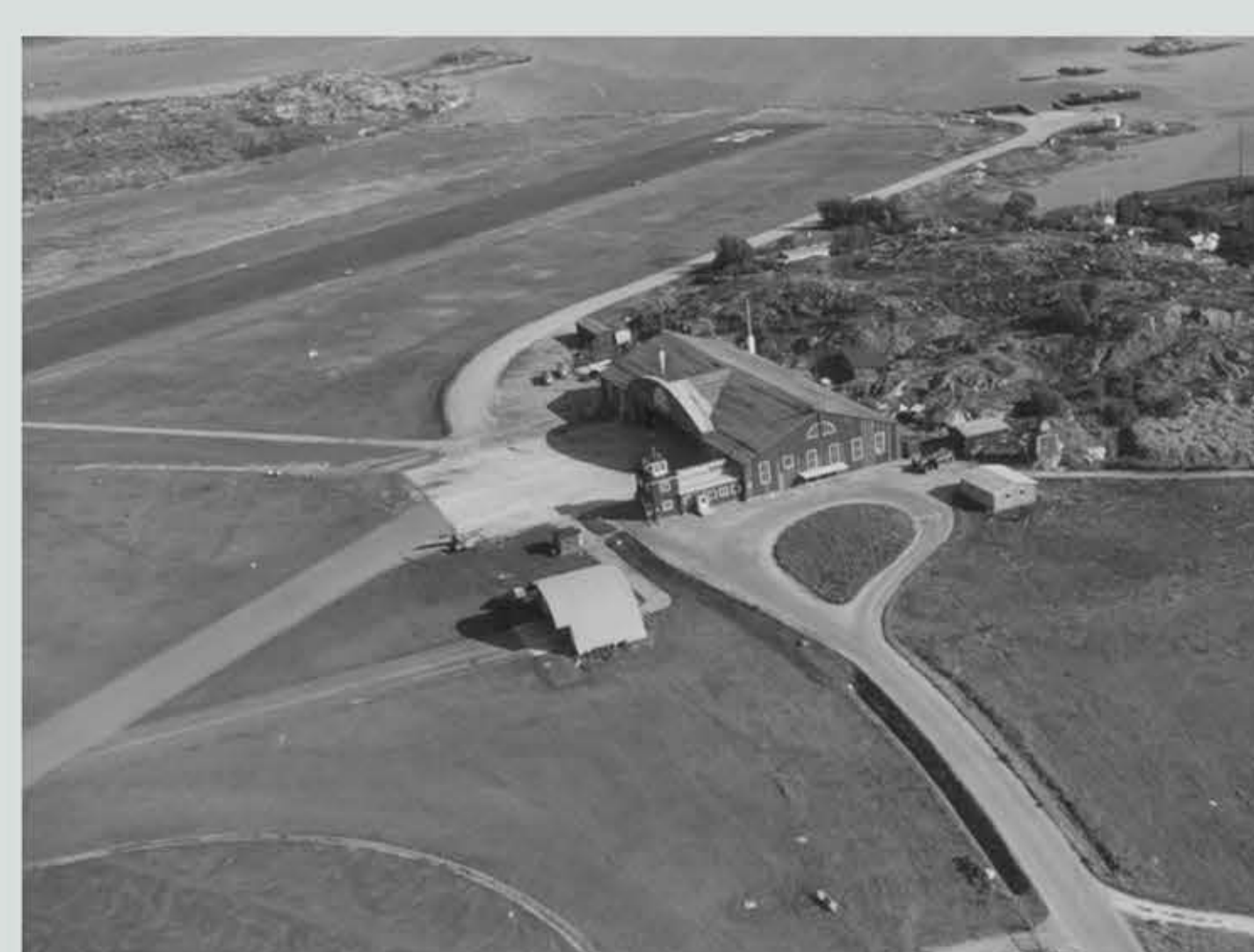
Nästan samma vy, nu några år senare ca 1945-50. Tälthangar på utsida mot fältet var avsedd för flygbolaget ABAs flygplan när de stannade över natten eller längre tid