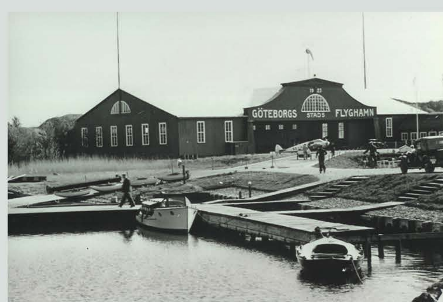
Vy från slipen där sjöflygplanen lade till. Sjöflygplan var den dominerande typen under 20-talet, främst för att det på de flesta platser saknades flygfält och att landa på vattnet gav ett oberoende av detta.