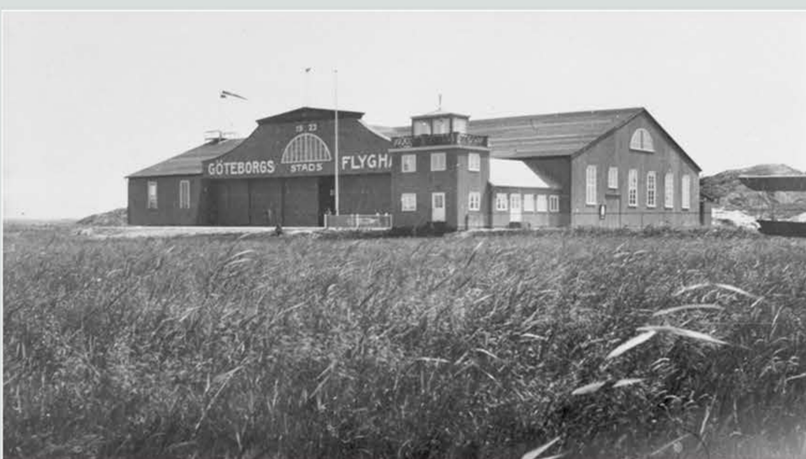
Blå hangaren som den blev kallad efter sin färgsättning som den såg ut under trettio-talet. En vinkelbyggnad tillkom 1927 med utrymme för passagerare, tull och flygbolag. Övre våningen och torn var för administration, radiostation och vädertjänst