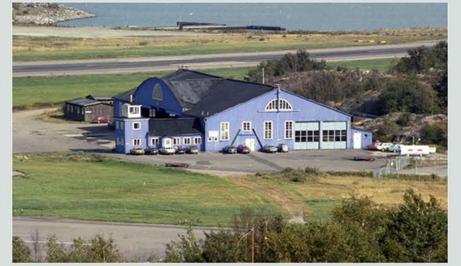
Portarna som syns på gaveln var för att polisen förvarade sina helikoptrar i ett avskilt utrymme i hangaren under slutet av 60-talet fram till det upphörde 1978-79.