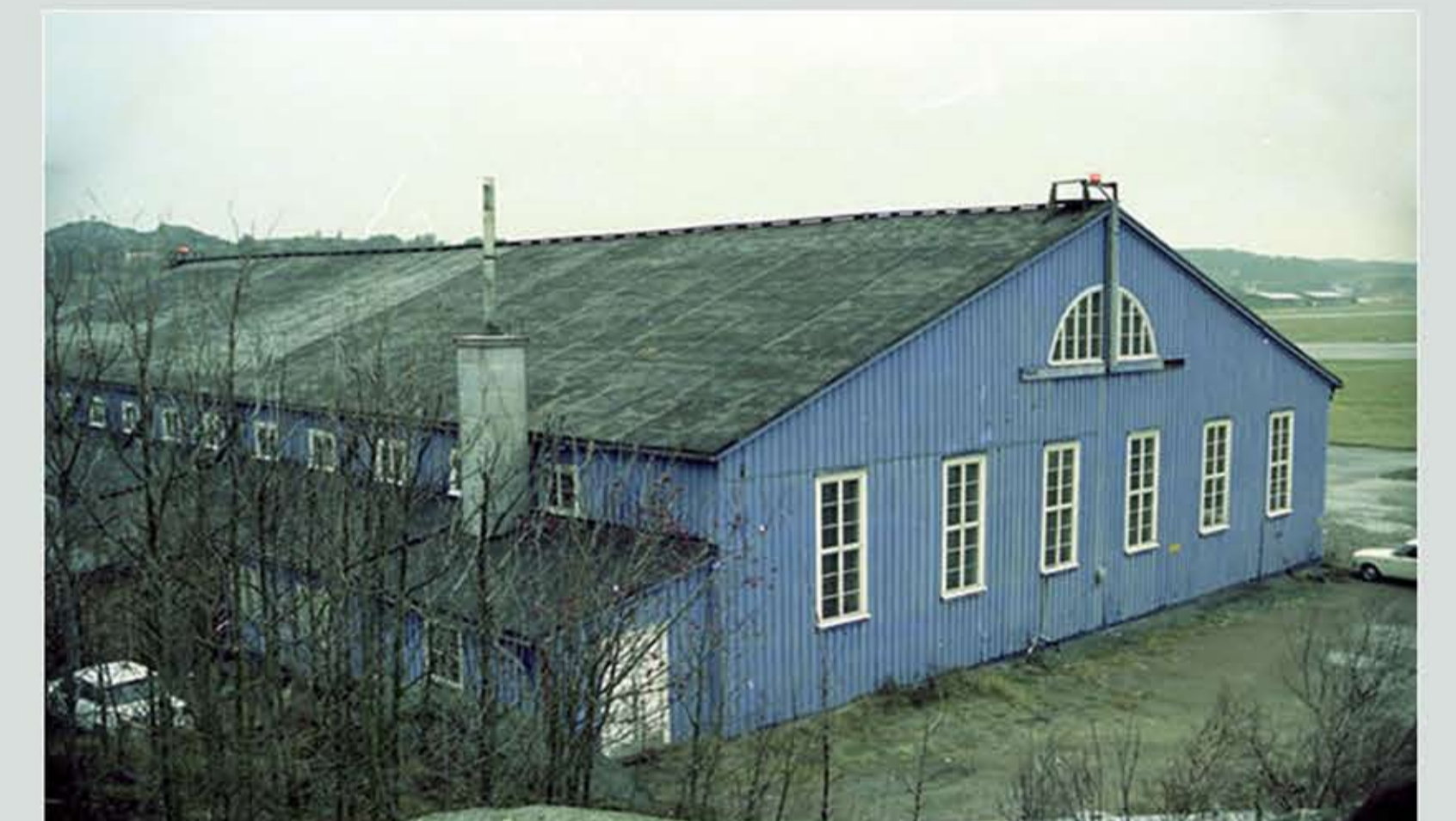
Baksida med tillbyggnader för värme och förrådsutrymme