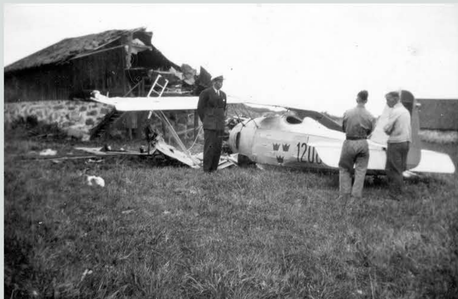
Här har en J6 "Jaktfalk" kraschat in i en mindre träbyggnad på flygfältets västra sida. Detta skedde den 12 juni 1938. Inga personsador.