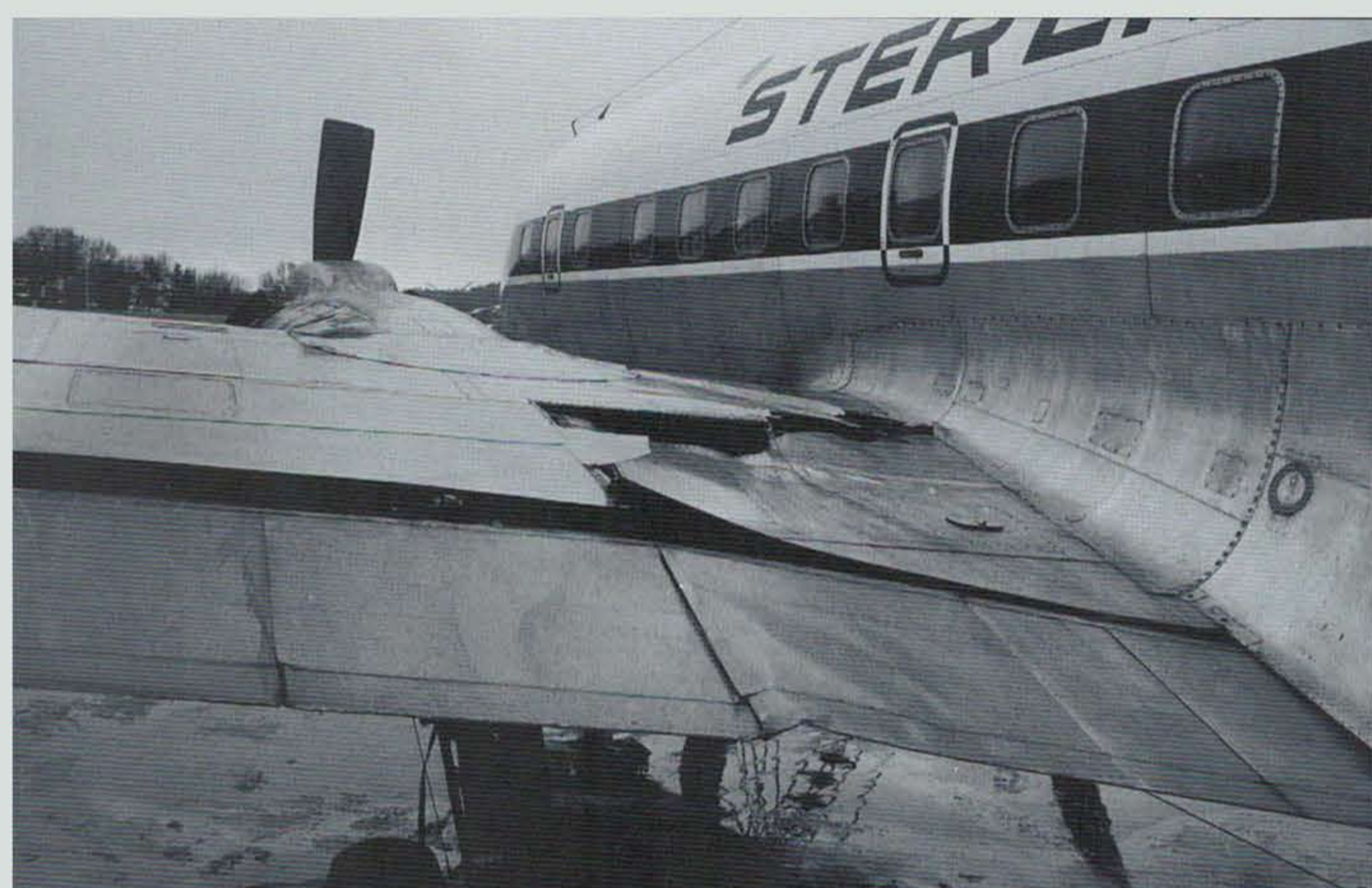
Efter ett andra försök att landa lyckades piloten landa en Sterling DC-6B. Detta skedde den 23 december 1967. Vid landningen trycktes vänster hjulstället upp i vingtanken och läckage uppstod. Lyckligtvis uppstod ingen brand och inga skadades. Flygplanet skrotades och blev brandövningsobjekt.