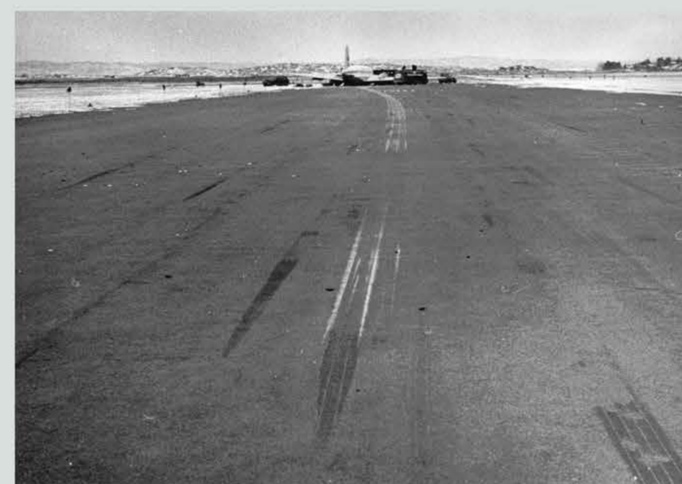
Den 24 februari 1954 buklandade en Vickers Viking från Eagle Aviation. Inga personer skadades och flygplanet kunde senare repareras i Hangar 2. På bilden syns spåren efter buklandningen.