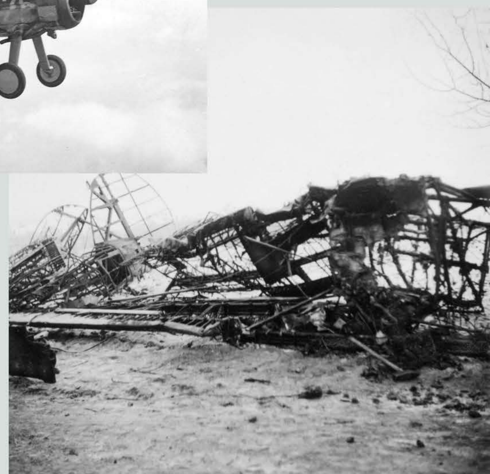
I en denna typ av flygplan omkom löjtnant Edgar Gustafsson då han kraschade med sin J 8 Gloster Gladiator 8 januari 1942 under andra världskriget. Han hade precis startat och lyft några meter då han girade vänster och slog i marken i Lysevägen. Enligt uppgift finns det ett märke i marken efter hans nedslag. Andra bilden visar resterna efter kraschen.