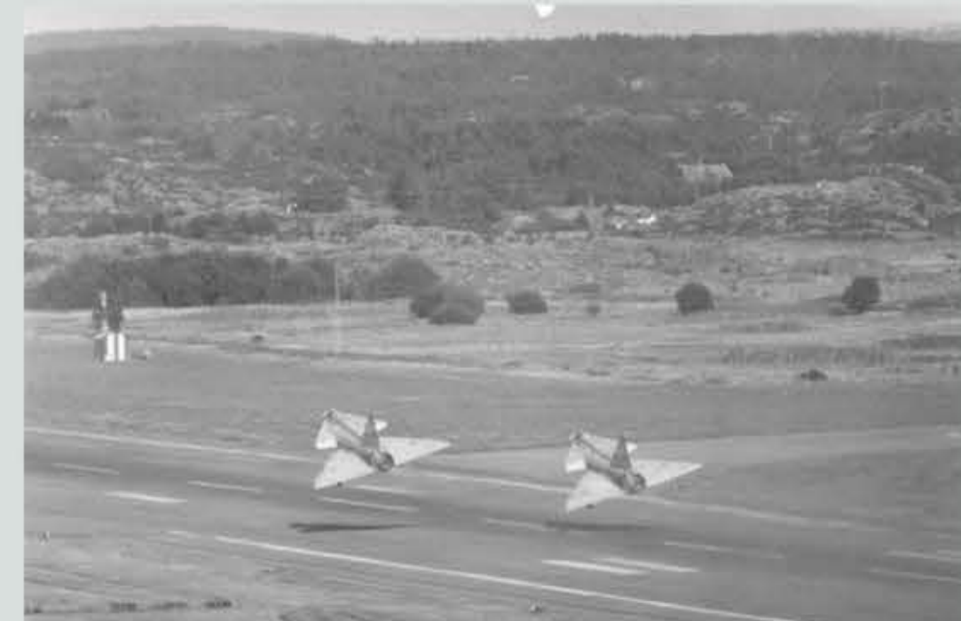
Rotestart av AJ 37 SAAB Viggen. Flygvapnets uppvisningsgrupp, baserad på F 7 Sätenäs.