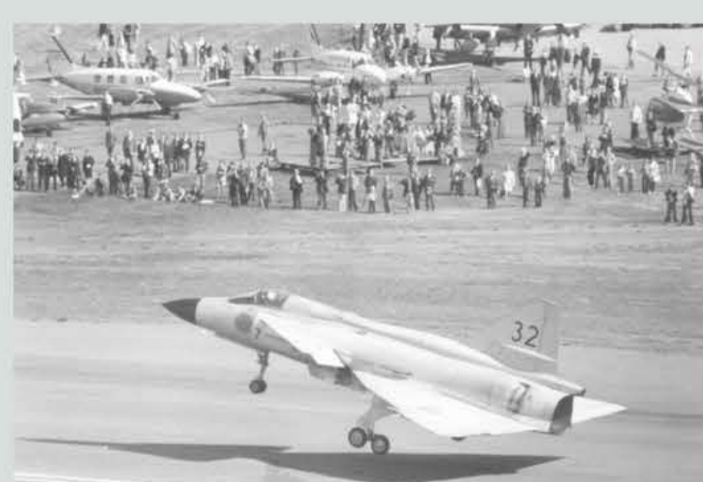
AJ 37 SAAB Viggen från F7 Sätenäs.