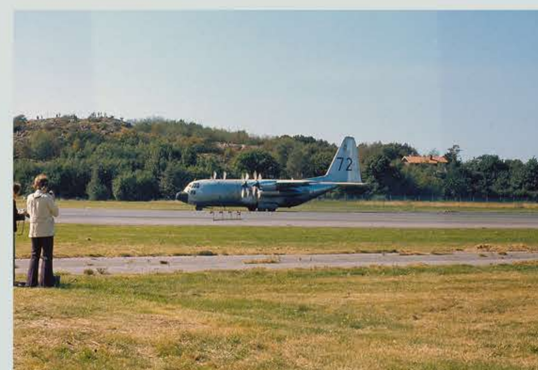
Tp 84 Lockheed Hercules från F7 Sätenäs.