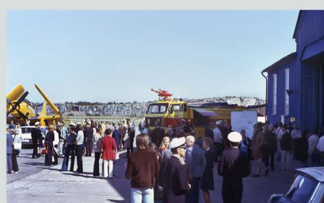
Visning av brandstationens utrustning.