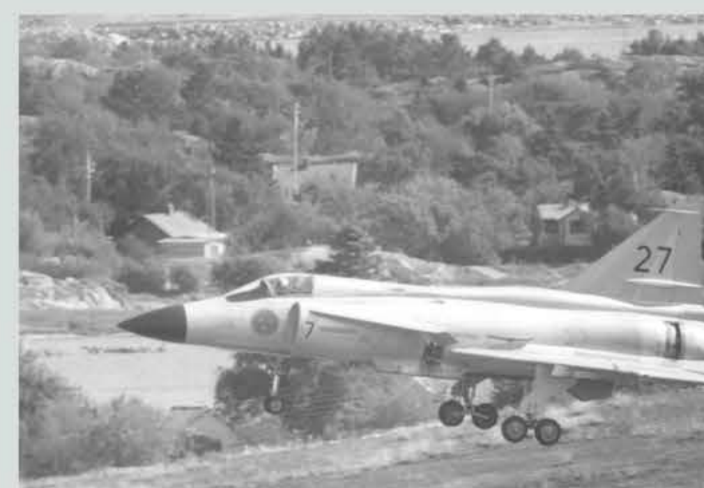
AJ 37 SAAB Viggen från F7 Sätenäs.