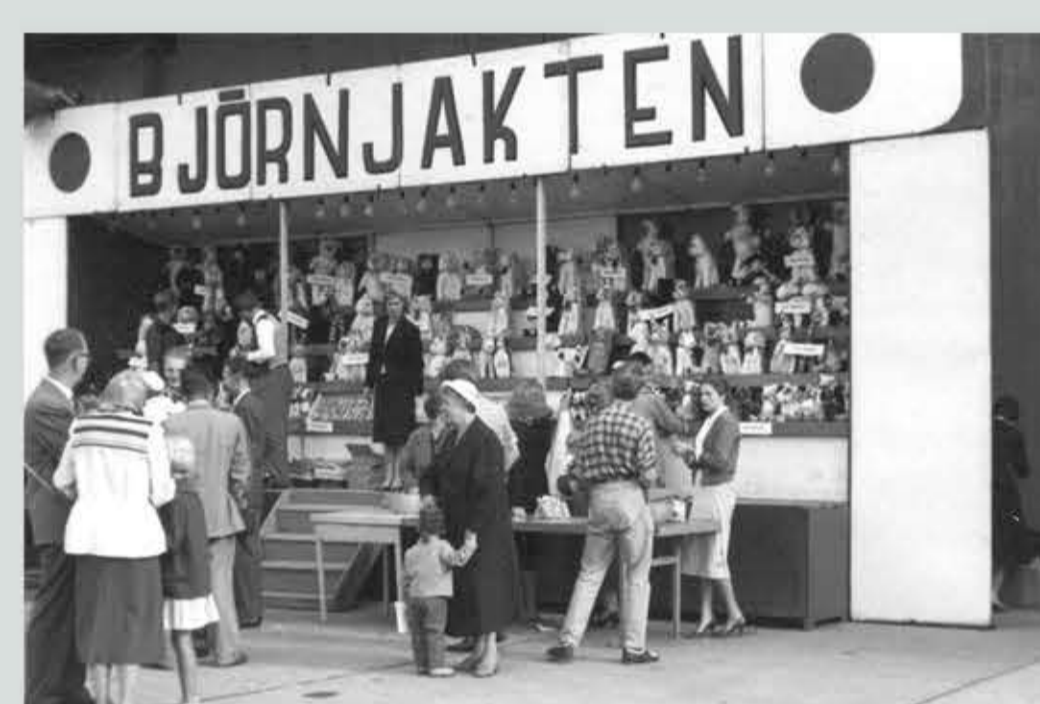
Björnjakten var en aktivitet där man kunde vinna nallebjörnar av olika storlekar.