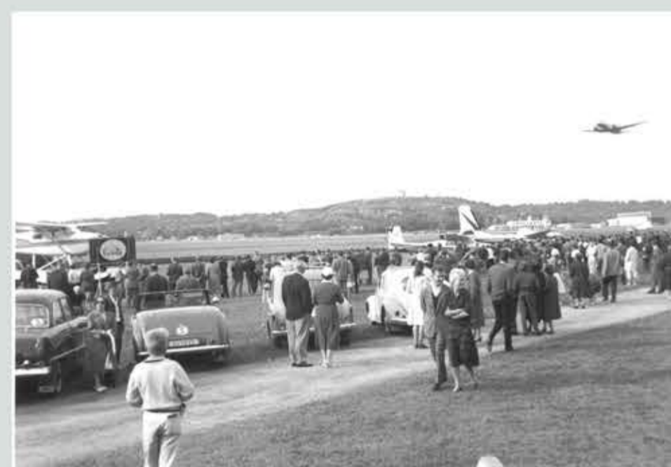
Under tiden flygdagen höll på landade och startade flygplanen där besökarna inte fick uppehålla sig.