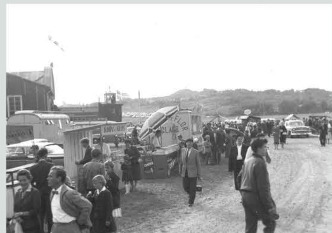
Vid Blå Hangaren fanns försäljare av bland annat korb och glass. Idag håller Torslanda Golfklubb till på detta område.