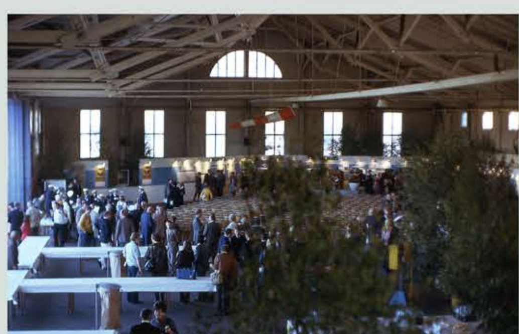
Inbjudna gäster i den Blå Hangaren under 50-årsjubileet.

25 augusti 1973 firade flygplatsen 50 år. I samband med detta visades ett antal flygplan upp med militär anknytning i första hand.