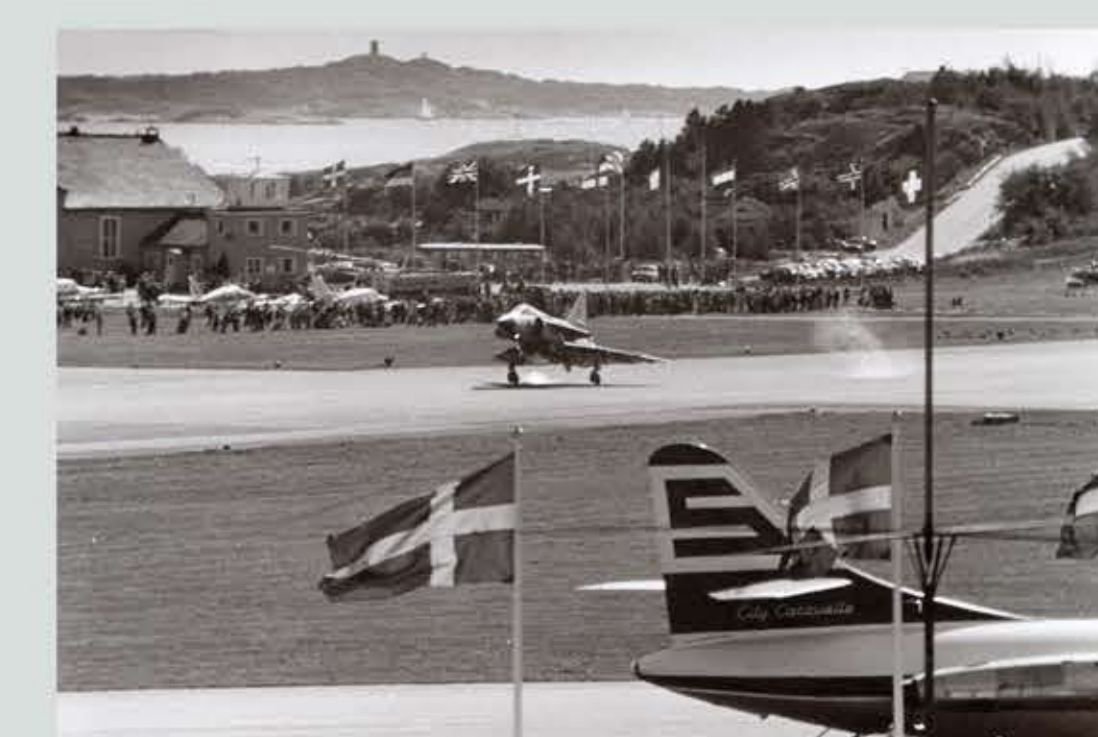
AJ 37 SAAB Viggen landar på bana 04 där besökarna står vid Blå Hangaren.