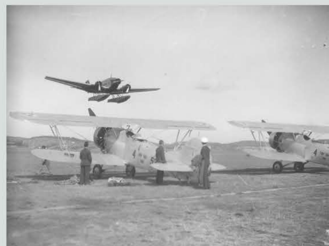
En Junkers JU-52 på låg höjd utrustad med pontoner och två B4 Hawker Hart från Jämtlands Flygflottilj, F4 på marken.