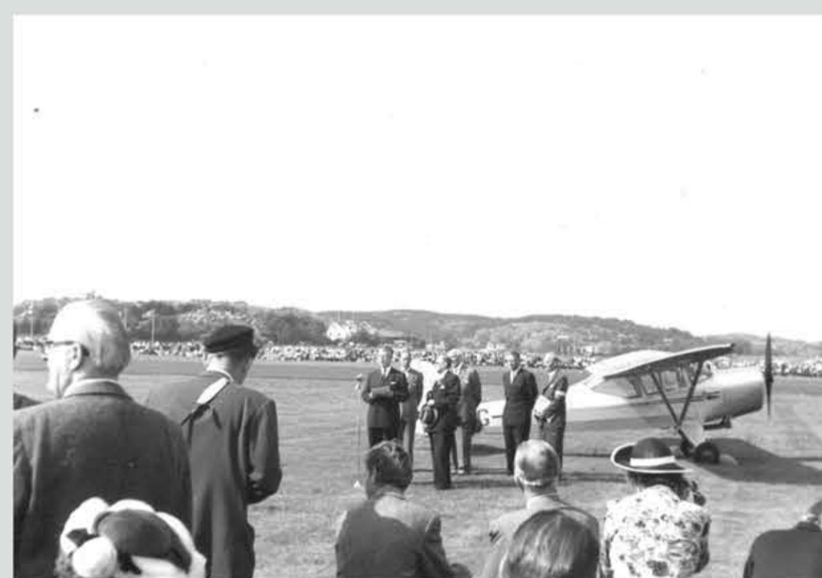
Landshövding Per Nyström förrättar invigningen.

Flygdagarna 30 och 31 augusti 1958 var mer av en folkfest och lockade många människor då det fanns aktiviteter för alla åldrar. Under året firade man att Aeroklubben fyllde 40 år och flygplatsen 35 år. Här är programbladet.