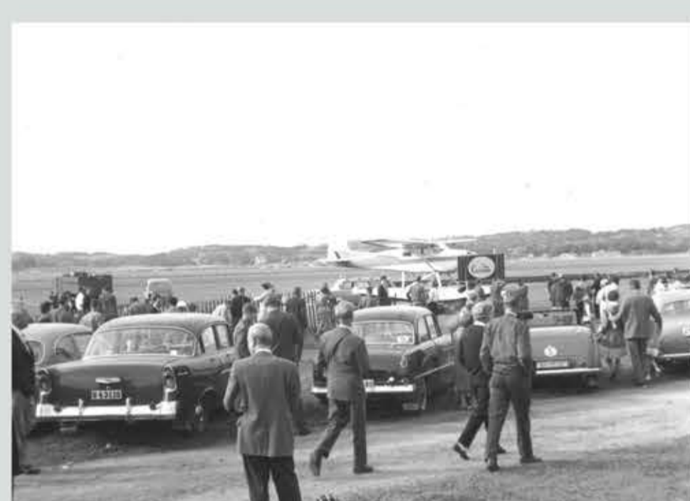
På väg mot en visning av flygplansmodellen Cessna.