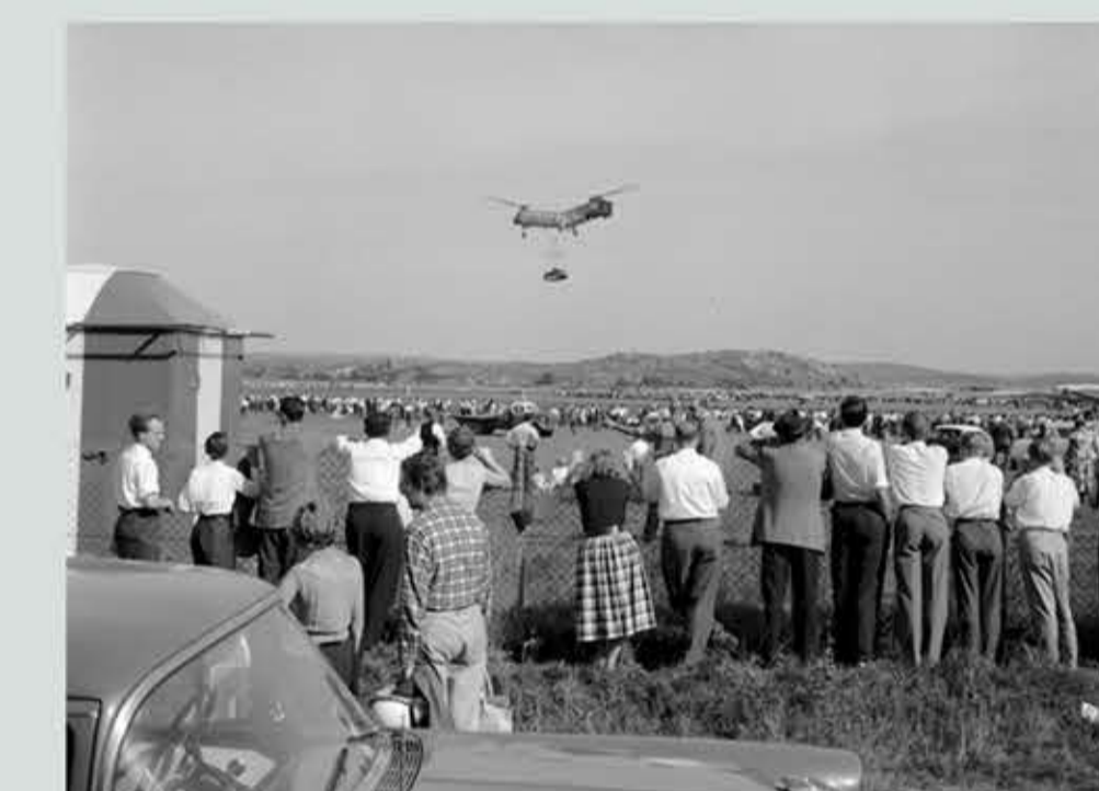
Hkp1 från Marinen demonstrerar sin kapacitet genom att lyfta en SAAB 92.