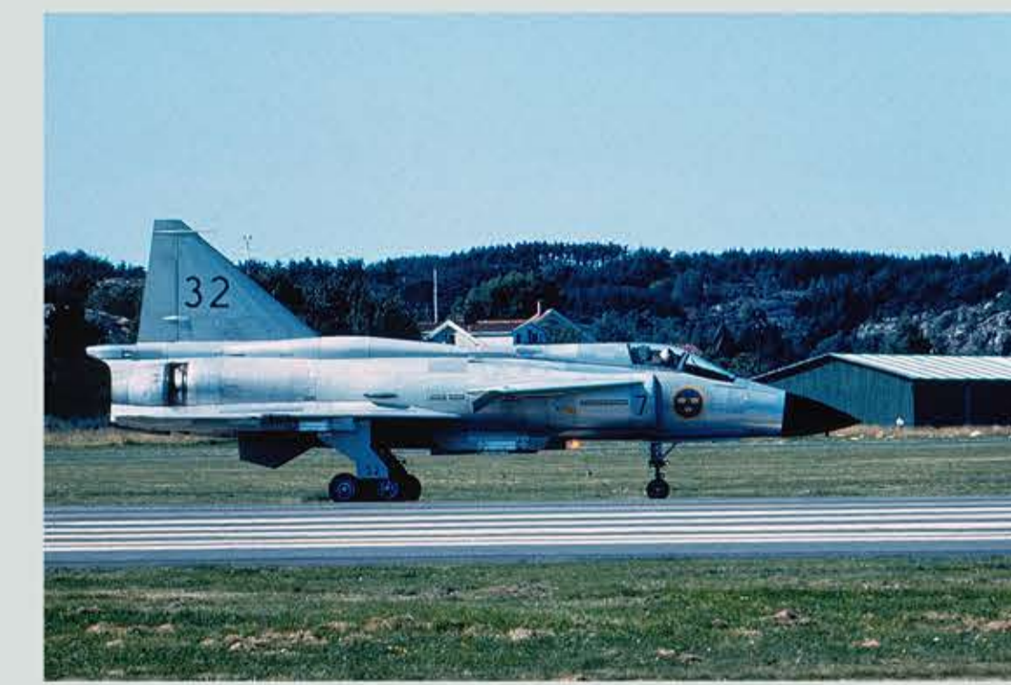
AJ 37 SAAB Viggen från F7 Sätenäs.