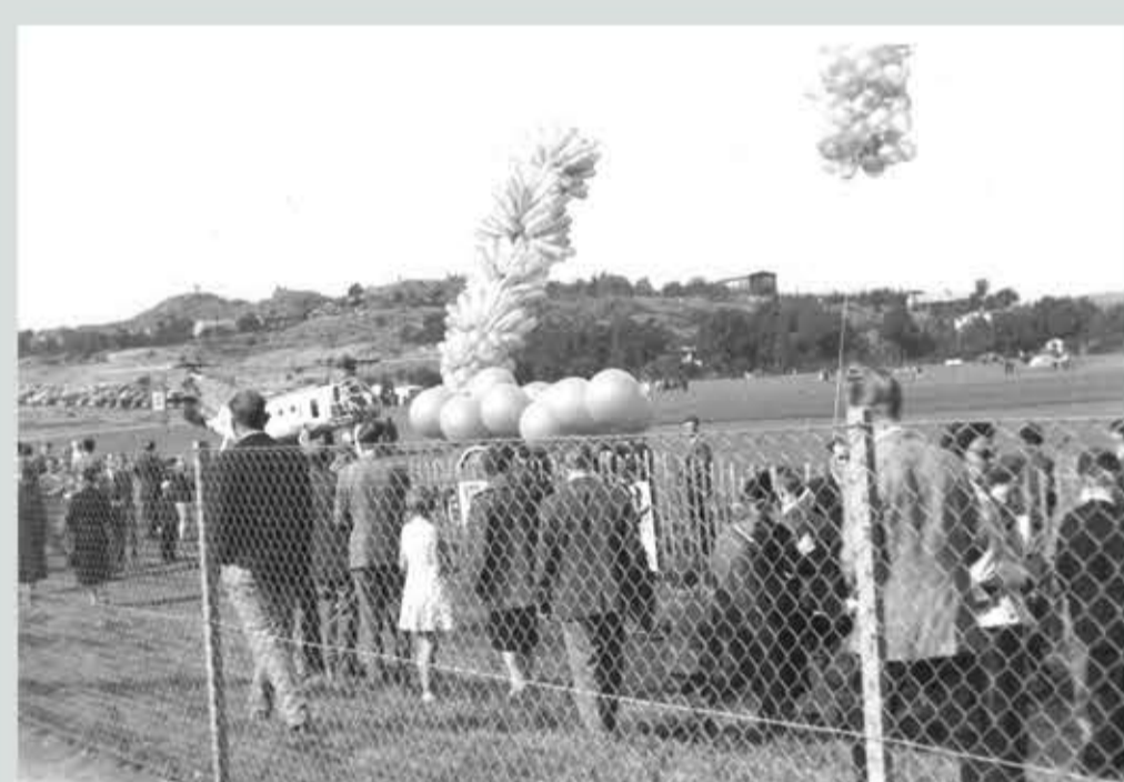
Folk på väg mot Marinens första helikoptertyp, Hkp 1 Boeing Vertol 44 som i folkmun kallades Bananen.