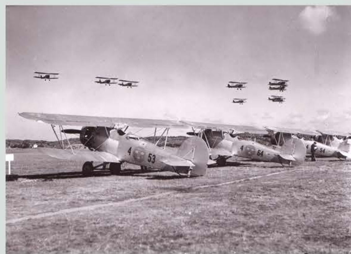
B4 Hawker Hart från Jämtlands Flygflottilj, F4 på marken och i luften.

Vid invigningen 1923 var allmänheten inbjuden att besöka flygplatsen och se på flygplan, som på den tiden var väldigt nytt för folk i allmänhet. 1937 och 1958 genomfördes flygdagar till vilka allmänheten också var inbjudna. Utvecklingen av flygplan både civilt och militärt gick snabbt. Vid flygdagarna hade man möjlighet att visa upp olika flygplanstyper och annat av intresse. Vid flygdagen 28 augusti 1937 var fokus i första hand att visa upp de militära flygplanen. Ett 60-tal flygplan visades upp.