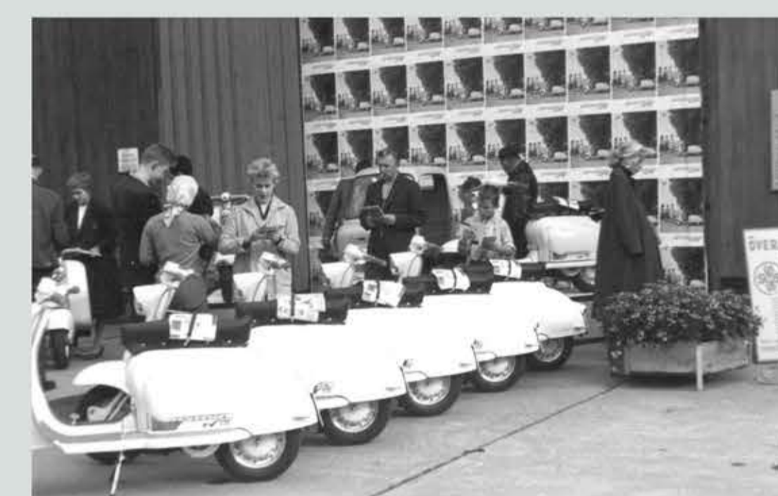
Företag ställde ut olika produkter. Här syns Lambretta med sina moderna scoters.