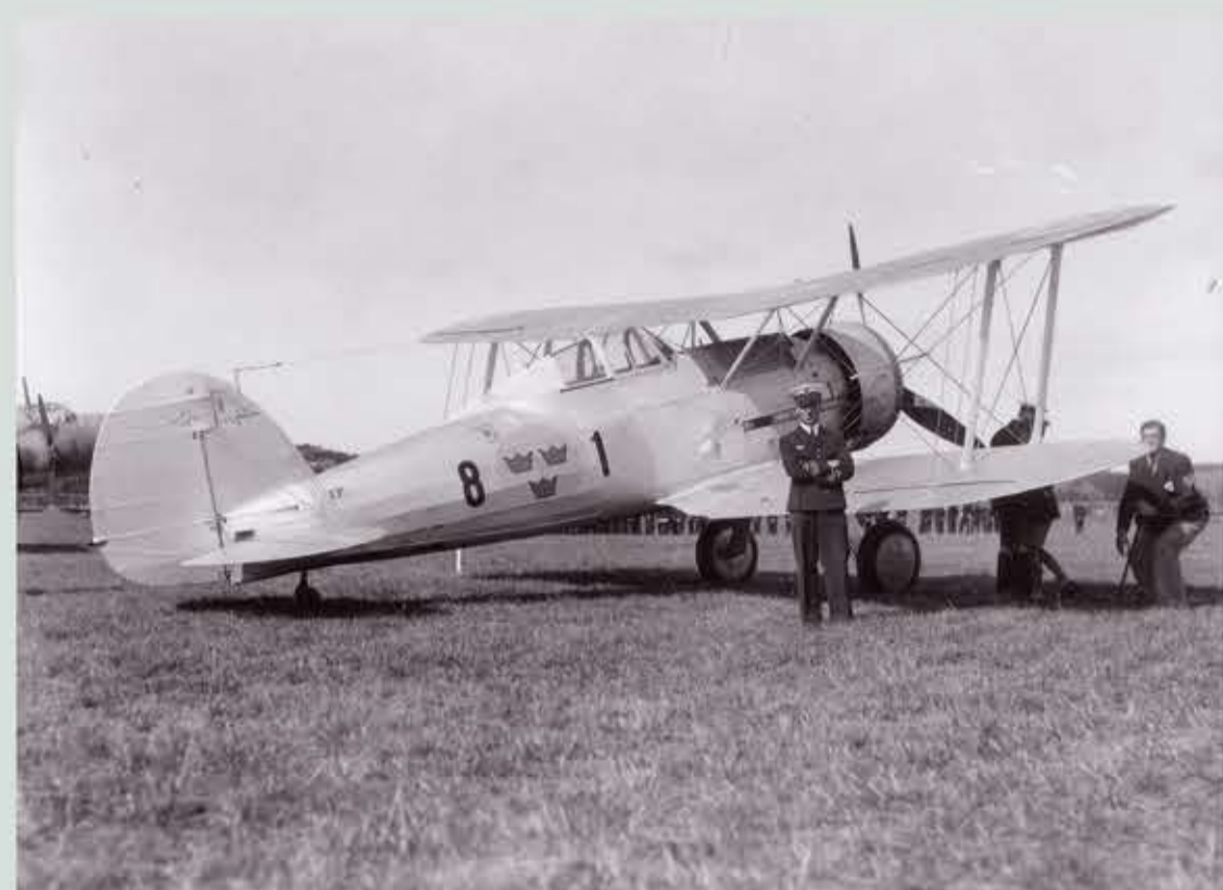
En J 8 Gloster Gladiator från Svea Flygflottilj, F8 på marken.