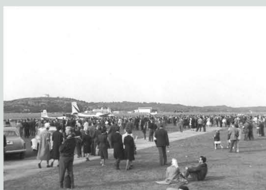
Som framgår av bilden var besökarna i alla åldrar.