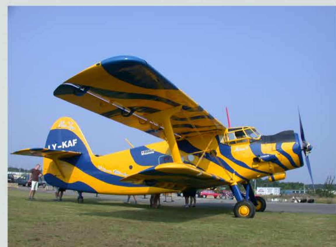
Ett färgglatt flygplan av modellen Antonov AN-2. Från Skala Väst 2002-08-17.

På detta flygfoto är landningsbanor och taxibanor inritade för att man skall kunna se var dessa låg jämfört med dagens Amhult.