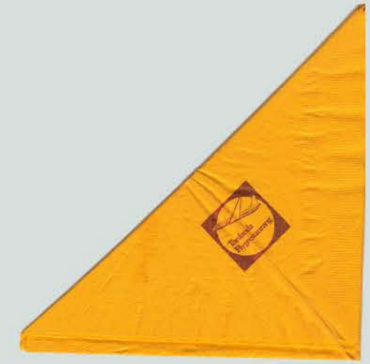
En servett från tiden det begav sig.