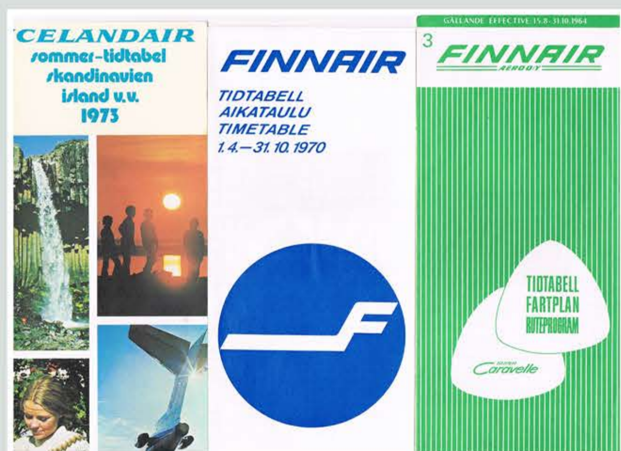
Icelandair och Finnair