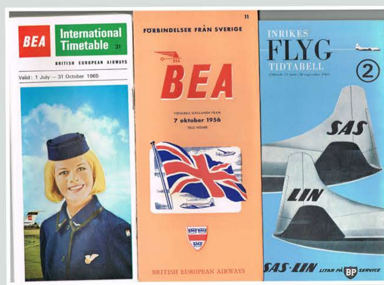
British Airlines, SAS och Linjeflyg