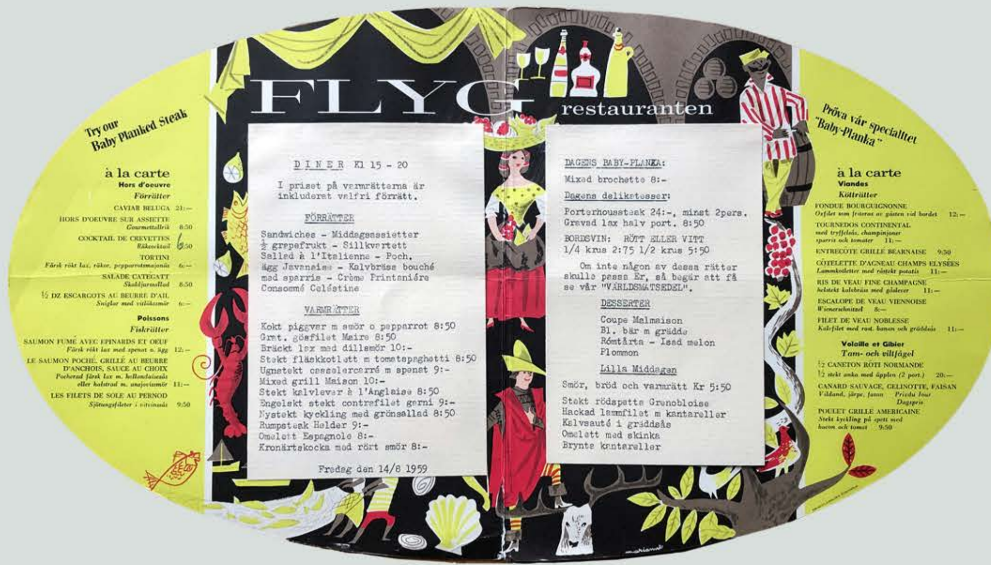
Det fanns oväntat många olika rätter att välja bland. OBS att i priset för varmrätter ingår valfri förrätt.