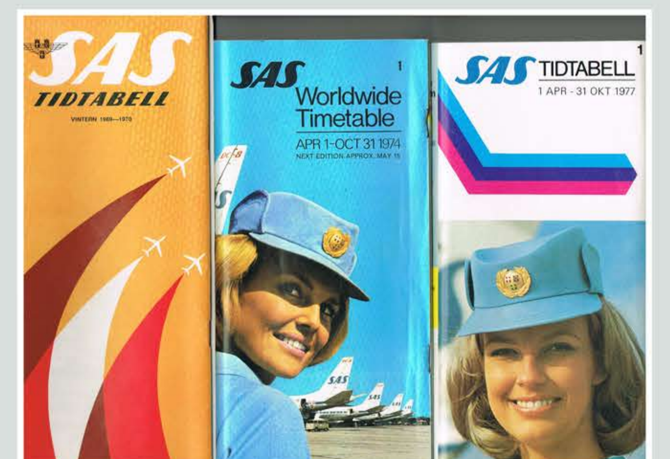
SAS-tidtabeller i olika versioner