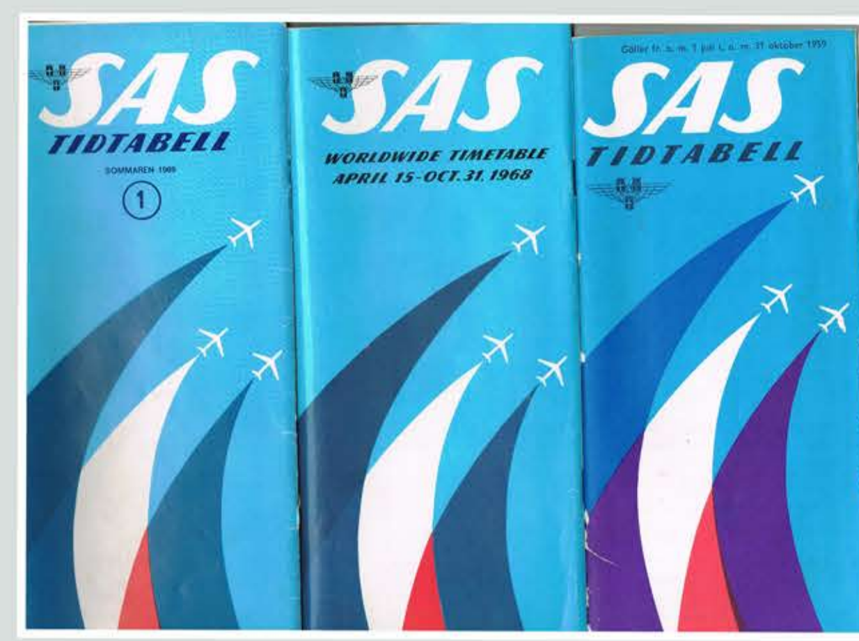
SAS-tidtabeller i olika versioner