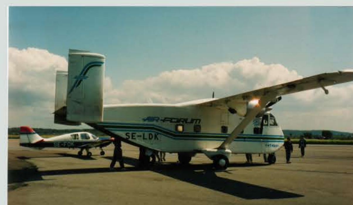
Shorts Skyvan SE-LDK, användes för fallskärmsbhopning.

Efter nedläggningen 1977 användes fältet av Flygklubbarna till sommaren 1978 då de flyttade till Säve. Torslanda användes fortsatt av Aero-klubbens modellflyg AKMG på den gamla bana 27. AKMG anordnade en familjedag 1995-06-10, se bilderna till höger.