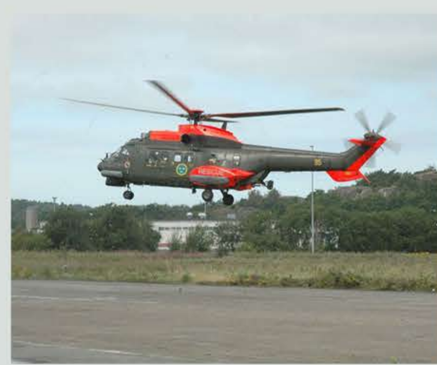
Hkp 10 Super Puma "H95" vid Skala Väst 2005-08-14.