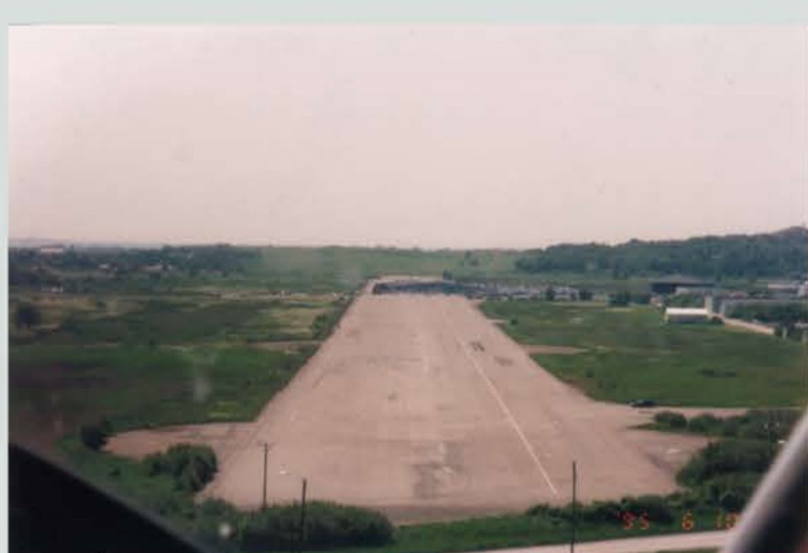
En bild också på inflygningen bana 22, den bandelen som användes fram till anläggningen för hantering av importerade bilar