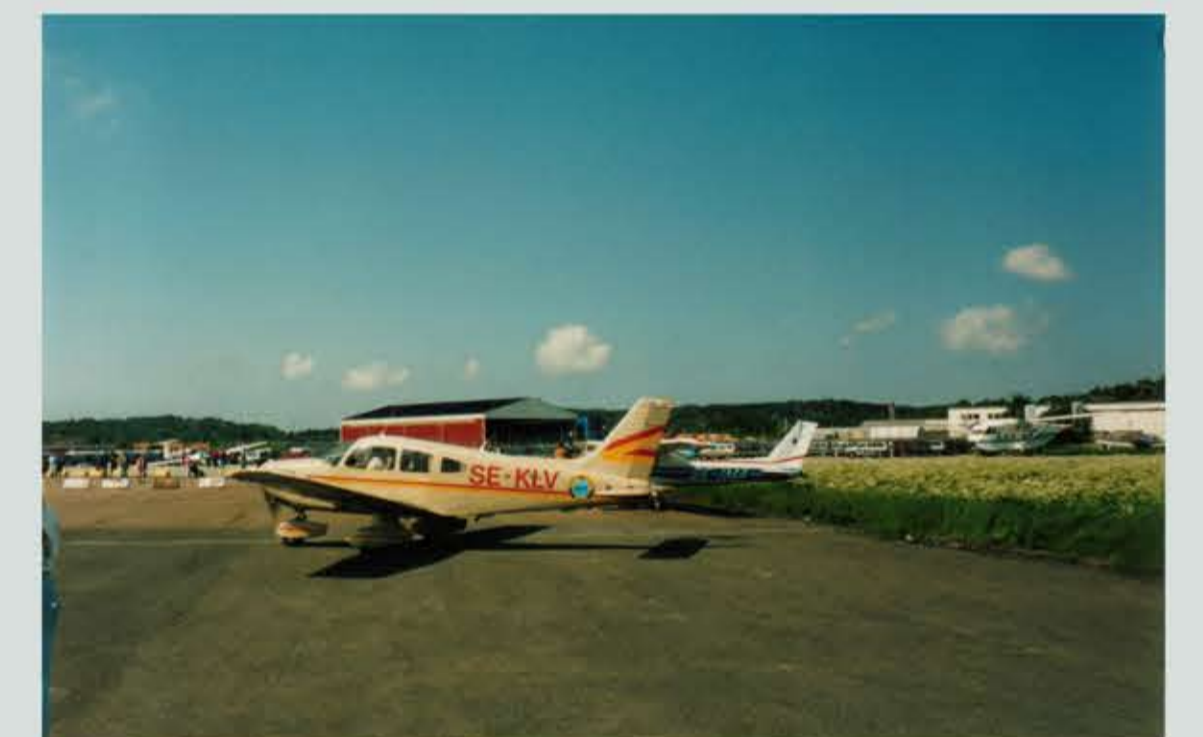
SE-KLV PA-28 Piper Archer.