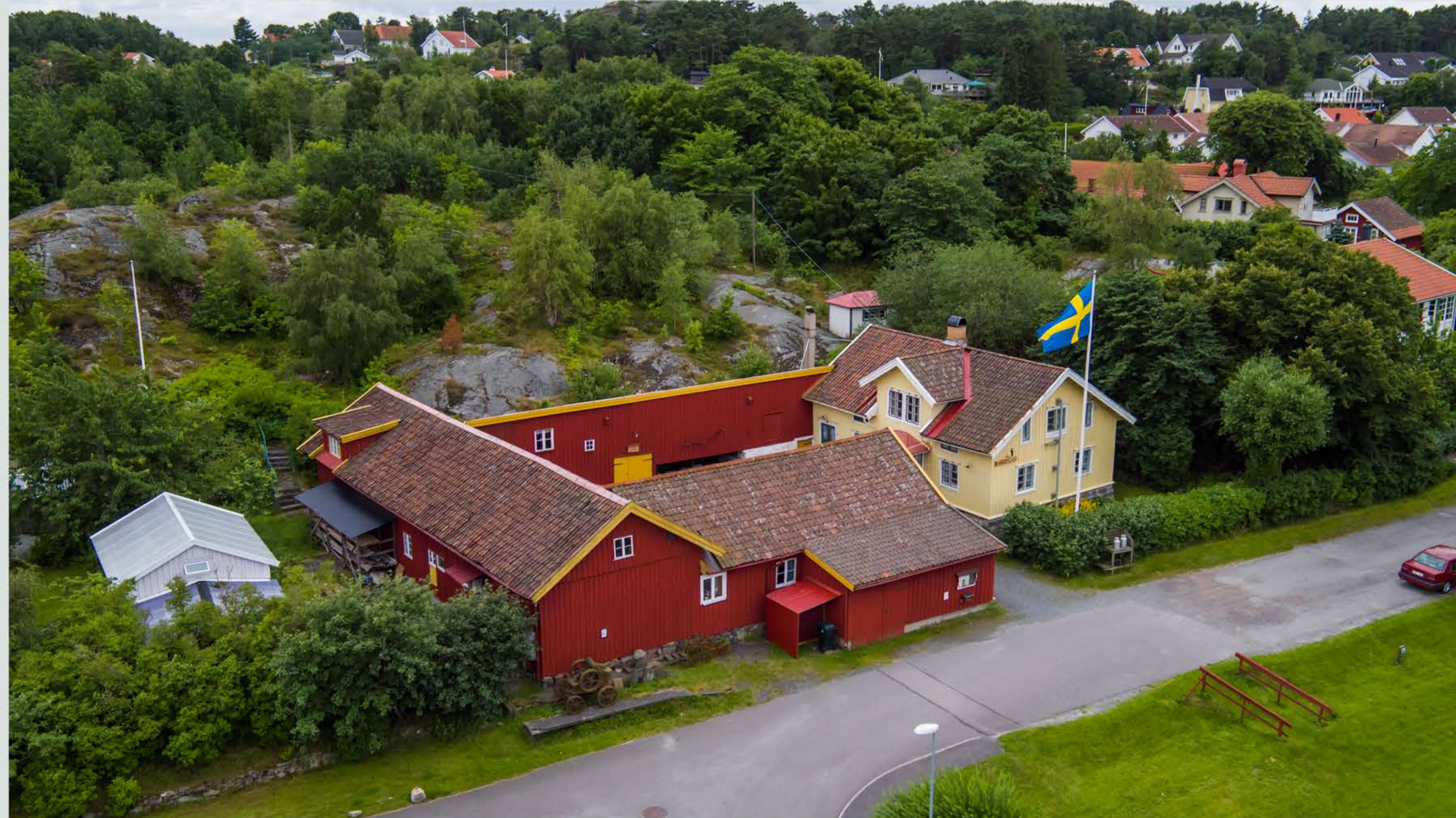
Björlanda-Torslanda hembygdsgårdens hembygdsgård, Lysevägen 5 i Torslanda.

QR-kod till Björlanda-Torslanda hembygdsgårdens hemsida: